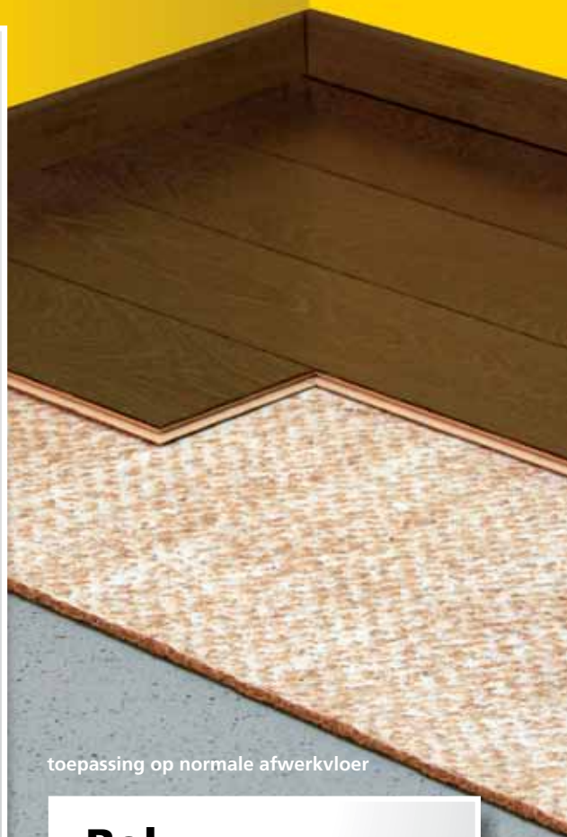
toepassing op normale afwerkvloer

Geluidsreducerende ondervloer voor click laminaat Uitermate geschikt voor vloerverwarming en vloerkoeling.